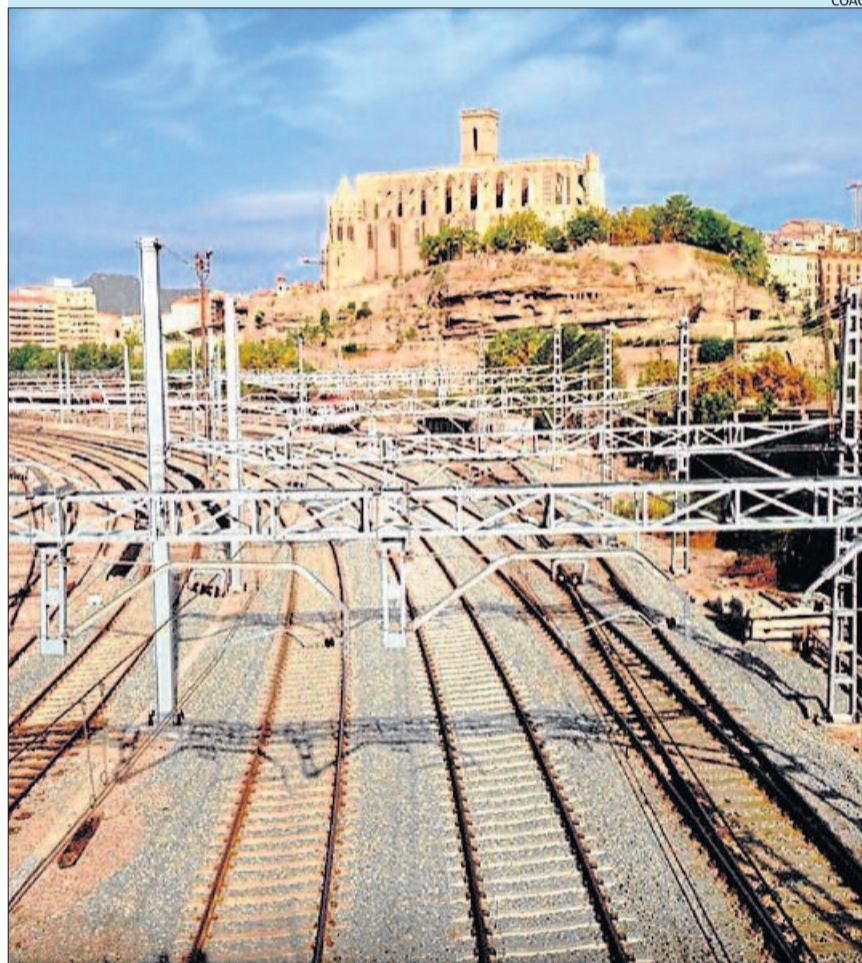
A dalt, les vies. A baix, la façana sud amb l'actual traçat de la Renfe