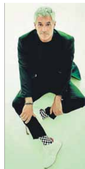
Sergio Dalma, a la portada de l'últim disc ■ SONY

El cantant català Sergio Dalma actuarà el divendres 25 de setembre a Casino Peralada (22 h), dins la gira de presentació del seu disc 30... y tanto , editat l'any passat per celebrar els seus 30 anys de carrera musical. Les entrades per a aquest concert, que tindrà lloc al nou pavelló del castell de Peralada, ja són a la venda al web de Casino Peralada, a