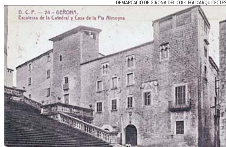
DEMARCACIÓ DE GIRONA DEL COL·LEGI D'ARQUITECTES