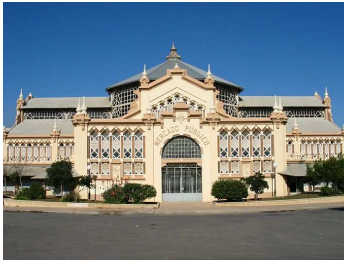
Antic Mercado de Abastos