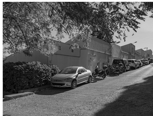
FASE III – 1964. Montbau Fotografia: Manolo Laguillo, 2020