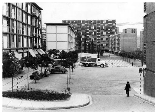
FASE I – 1958. Montbau