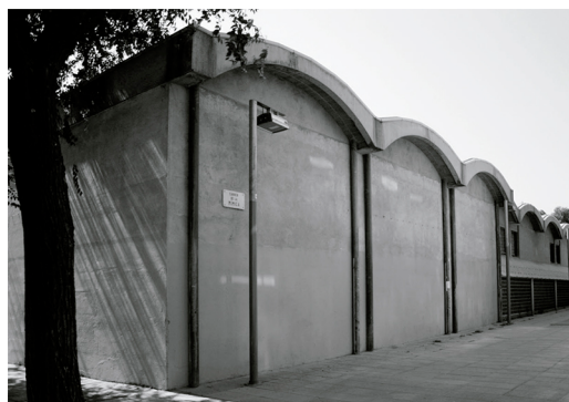
FASE II – 1961. Montbau