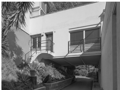
FASE III – 1964. Montbau Fotografia: Manolo Laguillo, 2020