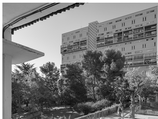
FASE I – 1958. Montbau