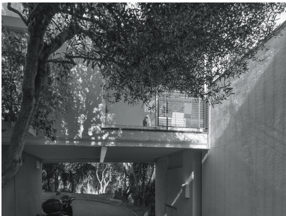
FASE III – 1964. Montbau