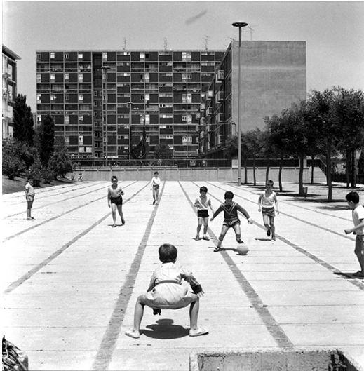
FASE I – 1958. Montbau

La primera és de 1958, la segona, de 1961 i la tercera, de 1964. Tot i la poca distància temporal que hi ha entre elles, les solucions plantejades són molt diferents, com a conseqüència dels canvis en la concepció de l'arquitectura i l'urbanisme sorgits en l'esfera internacional.