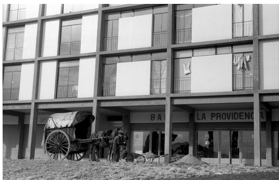
FASE I – 1958. Montbau

El carrer és principalment un espai verd corredor entre blocs edificats, i la vida social es concentra a la plaça. Aquesta té una organització neoplasticista, amb parterres, bancs continus i una font que incorpora una de les primeres escultures d'art abstracte de Barcelona. Aquestes característiques la converteixen, sens dubte, en un dels millors dissenys de l'espai públic de Barcelona.