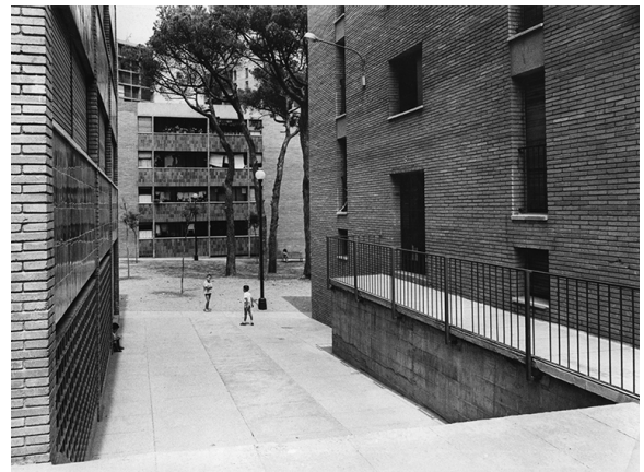
FASE II – 1961. Montbau