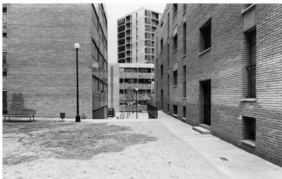
FASE II – 1961. Montbau

Aquesta segona fase inclou també l'edifici de l'església i el de la parròquia que, construït amb volta catalana, recorda l'obra de Le Corbusier del mateix període.