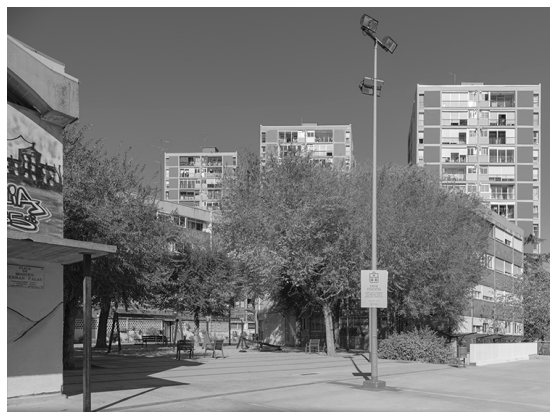
FASE II – 1961. Montbau