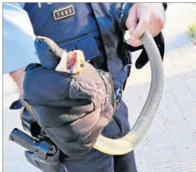
La serp trobada dimarts al carrer Jaume d'Agramunt.

| LLEIDA | L'hospital Arnau de Vilanova va adjudicar ahir diversos contractes de manteniment d'equips sanitaris. D'una banda, va tancar el contracte de manteniment dels equips d'angioradiologia a Philips Ibèrica per 302.777,47 euros. També va adjudicar el manteniment d'uns acceleradors i el software a l'empresa Varian Medical per 382.257 euros. Finalment, també va acordar la contractació del servei dels equips d'endoscòpia per 168.845,05 euros a Olympus Iberia.