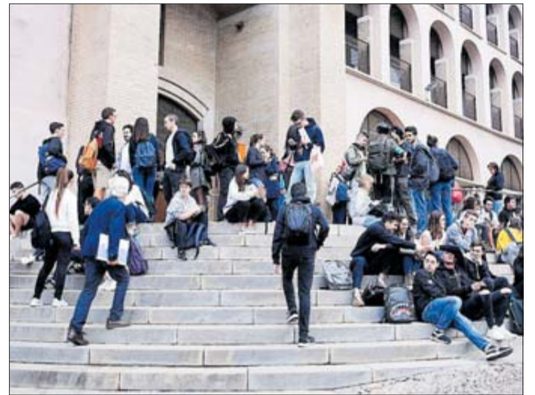
Estudiants a la porta de la Facultat de Lletres de la UdG. MARC MARTÍ

L'impacte que tenen les universitats sobre els ODS fixats per les Nacions Unides ha donat lloc a la segona edició d'aquest rànquing. Si bé en la primera edició pilot es van analitzar únicament 11 dels