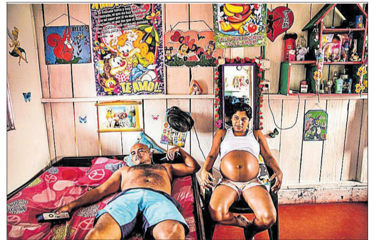
La foto finalista de Catalina Martin-Chico. REUTERS

► Els deu bisbats de Catalunya han preparat una trentena d'activitats per divulgar i obrir al públic, a través del programa Catalonia Sacra, el patrimoni cultural de l'Església. El bisbe de Girona, Francesc Pardo, va presentar ahir al claustre de la basílica de la Sagrada Família, a Barcelona, la programació d'aquest any, que inclou visites guiades, itineraris i conferències. La programació començarà al març i s'estendrà fins a l'octubre. Aquest any, com a novetat, Catalonia Sacra aprofitarà períodes com Setmana Santa o estiu per proposar, a través del seu web www.cataloniasacra.cat , activitats que el visitant podrà fer per lliure. Hi ha activitats per conèixer el monestir de Sant Salvador de Breda (6 d'abril), el Palau Episcopal de Girona (1 de juny), o conferències sobre els manuscrits de Sant Feliu de Girona (23 de març). EFE BARCELONA