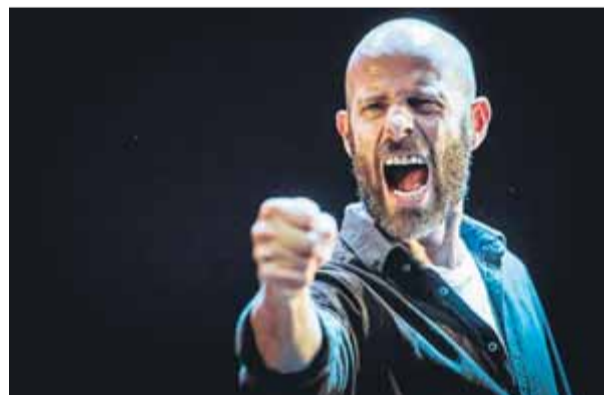
'Una Ilíada' ■ DAVID RUANO

cinemasta Ventura Pons. El 3 de febrer es representarà No m'oblidau mai , la darrera proposta de teatre documental de Mithistòrima Produccions i La Planeta, dirigit pel dramaturg Llàtzer Garcia. Dins la programació de teatre s'han inclòs les noves propostes de dues companyies de teatre locals. El mes d'abril es presentarà Fuuta , una de les primeres comèdies de Jordi Galceran