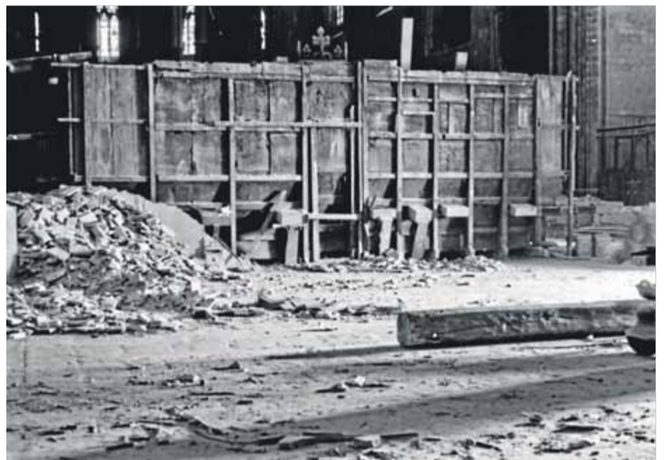
Dues imatges del cor i l'orgue de la catedral que apareixen en el llibre ■ ARXIU IEC / CRDI.

està dipositat a l'Arxiu de l'Institut d'Estudis Catalans. Una altra font remarkable és el de la Comissió de l'Arxiu Diocesà procedents de la catedral i del palau episcopal, amb la qual ressegueix des de les temptatives de salvament patrimonial fins a la idea i el projecte d'un "museu del poble", una iniciativa pionera i que, paradoxalment, s'acabaria conver-