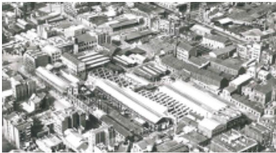
Federació d'Associacions de Veïns i Veïnes de Barcelona

El barri de Poble Nou va ser el bressol industrial de Catalunya. De fet, algunes persones el van denominar la "Manchester" catalana en al·lusió a la ciutat industrial anglesa. Després dels anys 70 la força industrial va decaure, moltes fàbriques van anar deixant de produir i el teixit productiu es va afeblir. Així, els edificis de treball van començar a estar acompanyats d'altres edificis d'associacions socioculturals i comercials, com Ateneus, Cooperatives de consum i d'altres espais col·lectius.